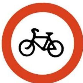
Движение на велосипедах запрещено