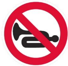
Подача звукового сигнала запрещена