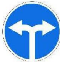
«Движение направо или налево»