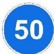
«Ограничение минимальной скорости»