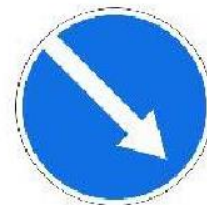
«Объезд препятствия справа»