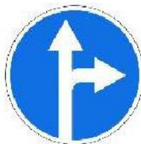
«Движение прямо или направо»